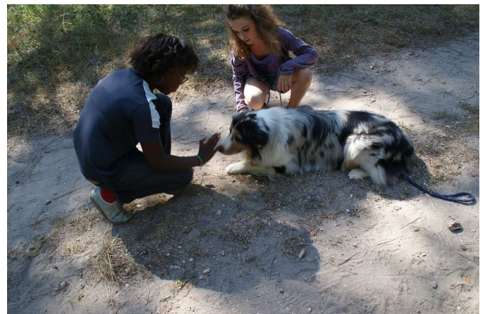
« couché »